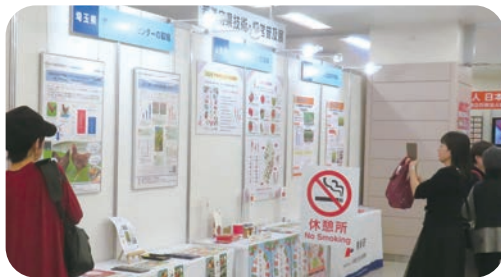
埼玉・山形・北海道

都道府県の独自性を有する農業技術や特徴ある農林水産物について、9道県の出展により実物、パネル等で展示紹介されました。