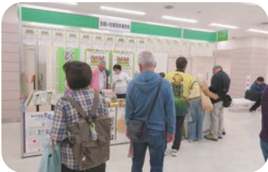
全国い生産団体連合会