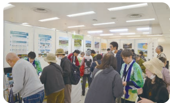
日本の農業はすごい！農業遺産を応援しよう