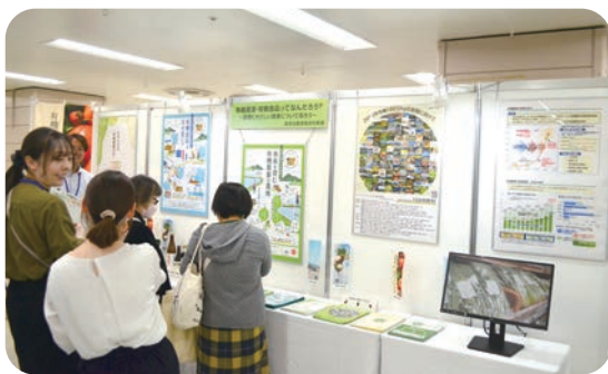
有機農業・有機食品ってなんだろう？