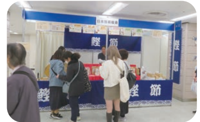
(一社) 日本鯉節協会