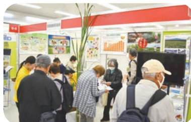
(独) 農畜産業振興機構