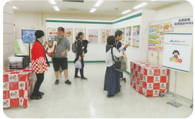
(一社) 全国農業協同組合中央会（JA ひろば）