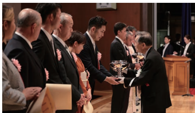
天皇杯授与の様子