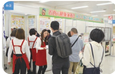
全国食肉生活衛生同業組合連合会