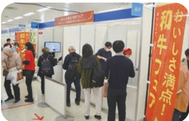
(公財) 日本食肉消費総合センター