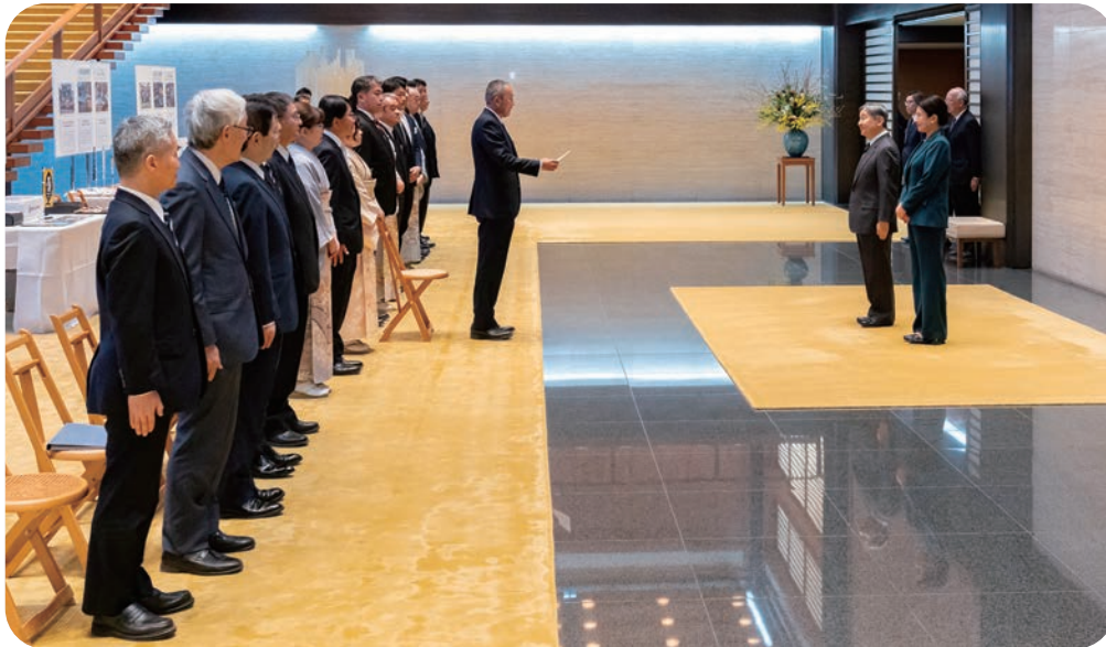
天皇杯受賞者のお礼言上

令和7年度の農林水産祭参加表彰行事において、7部門それぞれで最も優秀な農林水産業者として選定され、最高の榮譽に輝いた天皇杯受賞者は、令和8年1月29日（木）に皇居宮殿北溜において天皇皇后両陛下に拝謁し、受賞者の代表から天皇杯受賞に対するお礼言上を行い、天皇陛下から励ましのお言葉をいただきました。