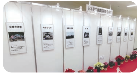
日本農林漁業振興会会長賞パネル