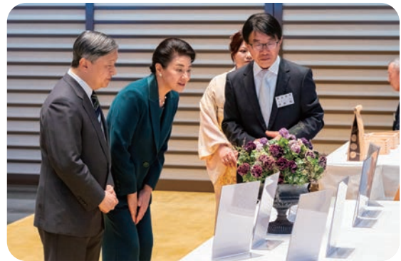
園芸部門の業績説明

各天皇杯受賞者のご説明に対して、両陛下から、展示物に関する技術や経営、生産状況等について多岐にわたるご下問があり、短い時間の中でそれぞれ温かい励ましのお言葉をいただきました。