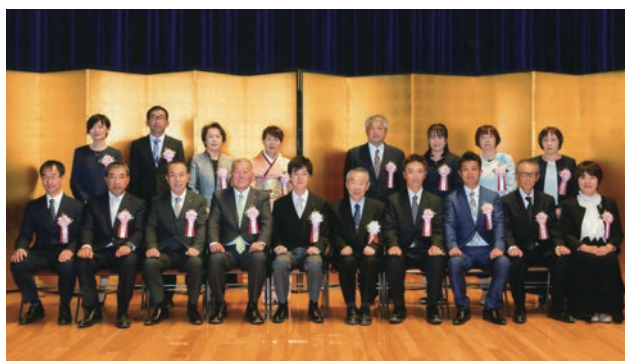
内閣総理大臣賞受賞者