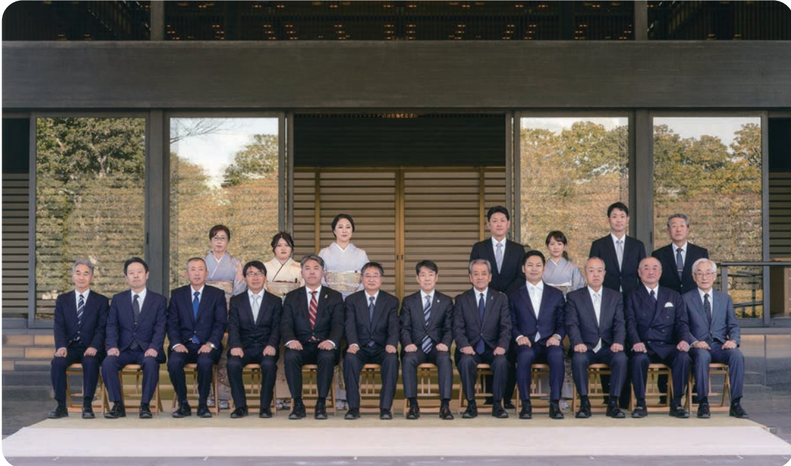
天皇杯受賞者を囲んで記念撮影

拜謁・業績説明に先立ち、宮内庁担当者の案内により、皇居特別参観が行われ、宮殿と回廊に囲まれた中庭、二重橋、賢所、生物学研究所（水田）、大道庭園、紅葉山御養蚕所等を参観しました。また、皇居宮殿北車寄せにおいて、天皇杯受賞者を囲んで記念撮影が行われました。