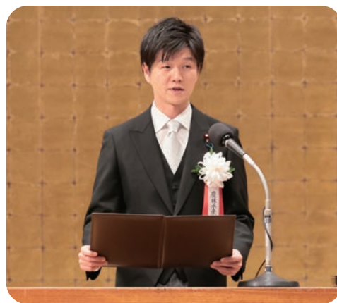
鈴木 憲和 農林水産大臣

結びに、全国の農林水産業に携わる方々の益々の御発展と、御健勝を祈念いたしまして、私の挨拶といたします。