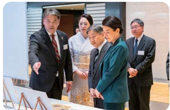
畜産部門の業績説明