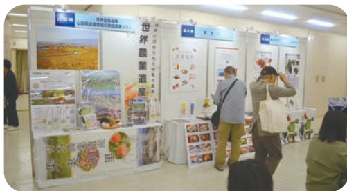
山梨・福井・愛知