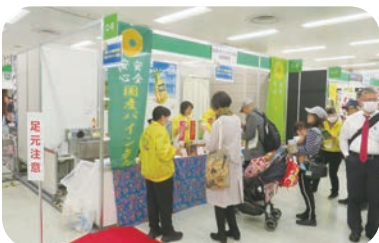
(一社) 日本パインアップル缶詰協会