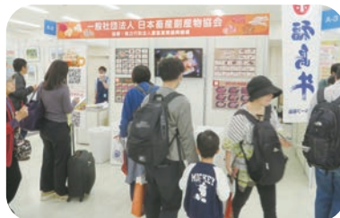
(一社) 日本畜産副産物協会