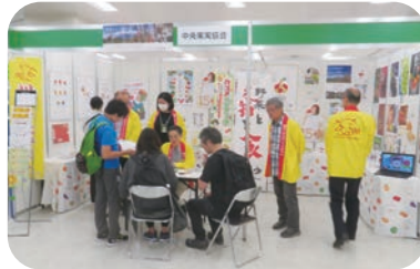
(公財) 中央果実協会