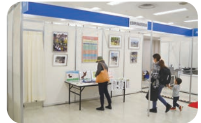
(公社) 全国乗馬倶楽部振興協会