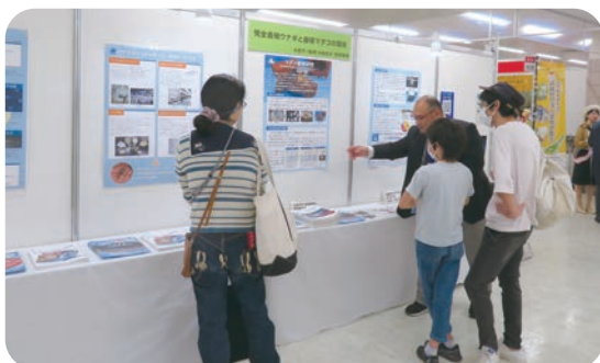
完全養殖ウナギと養殖マグロの現状