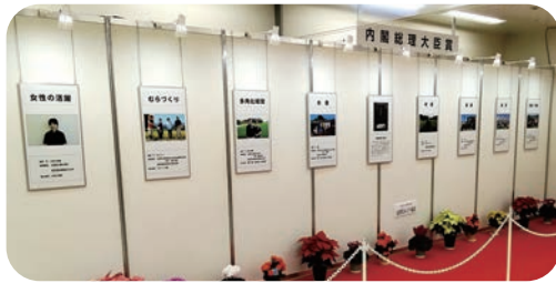
内閣総理大臣賞パネル

令和7年度農林水産祭内閣総理大臣賞及び日本農林漁業振興会会長賞の受賞者をパネルで展示紹介しました。