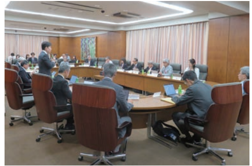
農林水産祭中央審査委員会第2回総会

令和7年度の天皇杯等三賞（天皇杯、内閣総理大臣賞、日本農林漁業振興会会長賞）の選賞審査は、7月1日（火）に開催された農林水産祭中央審査委員会第1回総会を皮切りに、経営（兼多角化経営）、農産・蚕糸、園芸、畜産、林産、水産、むらづくりの各分科会において行われました。令和6年7月から令和7年6月にかけて全国で開催された276の農林水産祭参加表彰行事で農林水産大臣賞を受賞された優秀農林水産業者453点（団体、夫婦連名を含む）を対象に、部門毎に書類審査と現地調査による厳正な審査が行われ、10月1日（水）の中央審査委員会第2回総会において天皇杯等三賞の受賞者が決定され、同2日（木）農林水産省 Web サイトで公表されました。