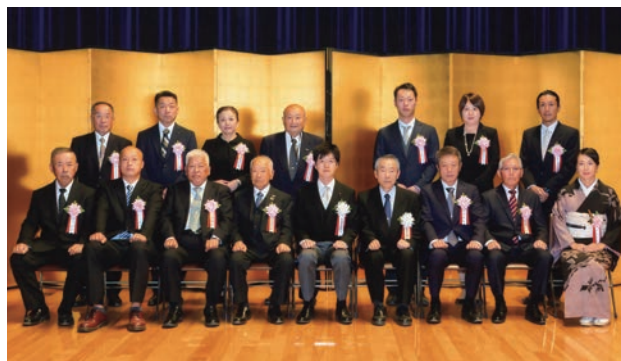
日本農林漁業振興会会長賞受賞者