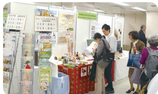
気候変動に対応するための研究開発