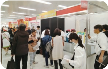
全国食肉事業協同組合連合会