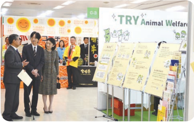
(公社) 畜産技術協会

また、来場者が参加できる体験コーナーやクイズ、試食・試飲が楽しめるコーナーなど各種の展示が行われ、賑わいました。